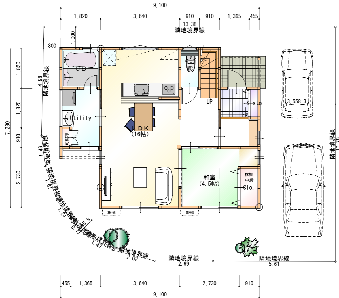
●1階 平面図 S:1/100