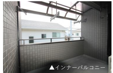
▲インナーバルコニー