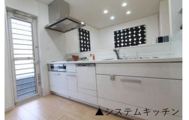
▲システムキッチン