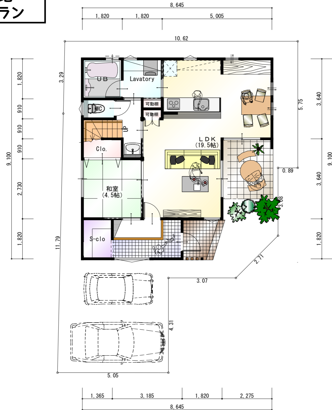
●1階 平面図 S:1/100