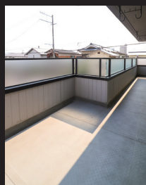
洗濯物もたっぷり干せる広いバルコニー。