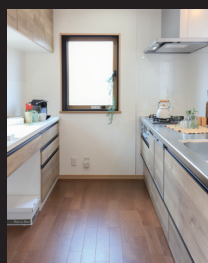
キッチンが清潔感のあるクリナップ製品に。