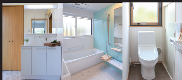
UB、洗面台、トイレは安心のTOTO製品に。