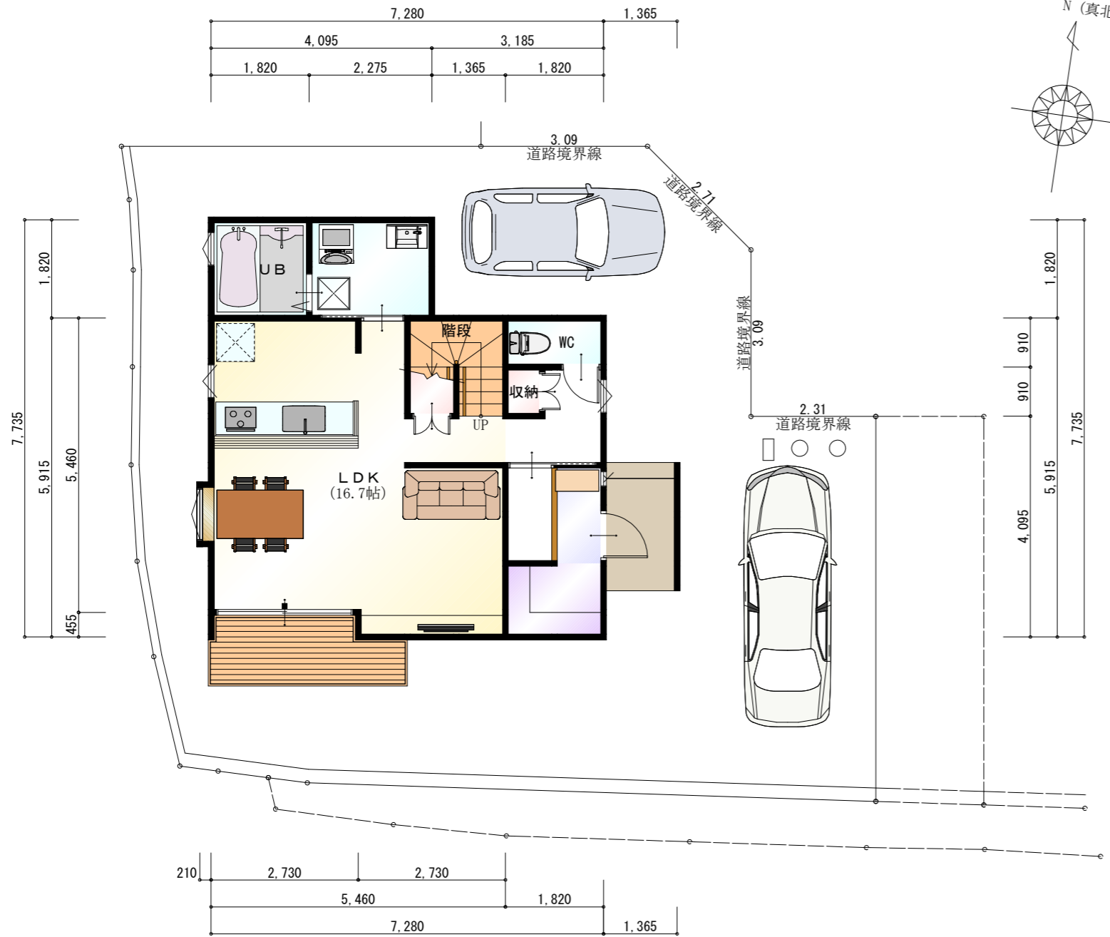
●1階 平面図 S:1/100