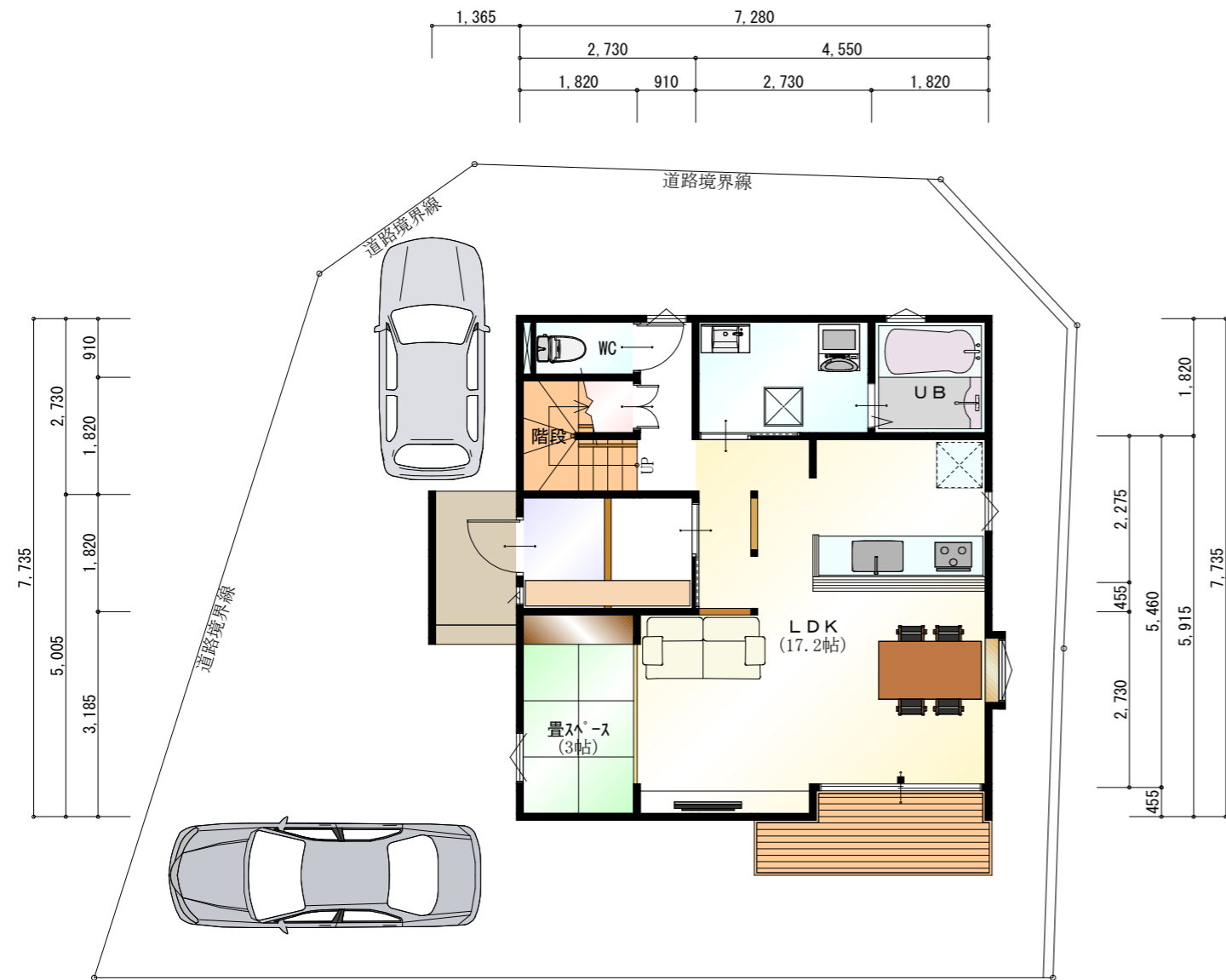
● 1階 平面図 S:1/100