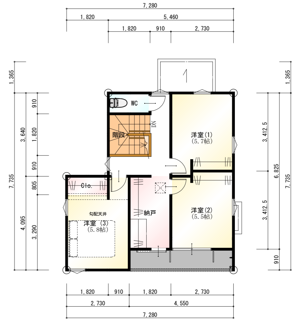
●2階 平面図 S:1/100