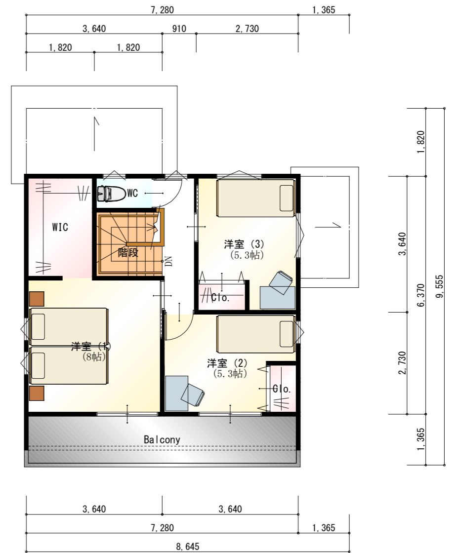
2階 平面図 S:1/100