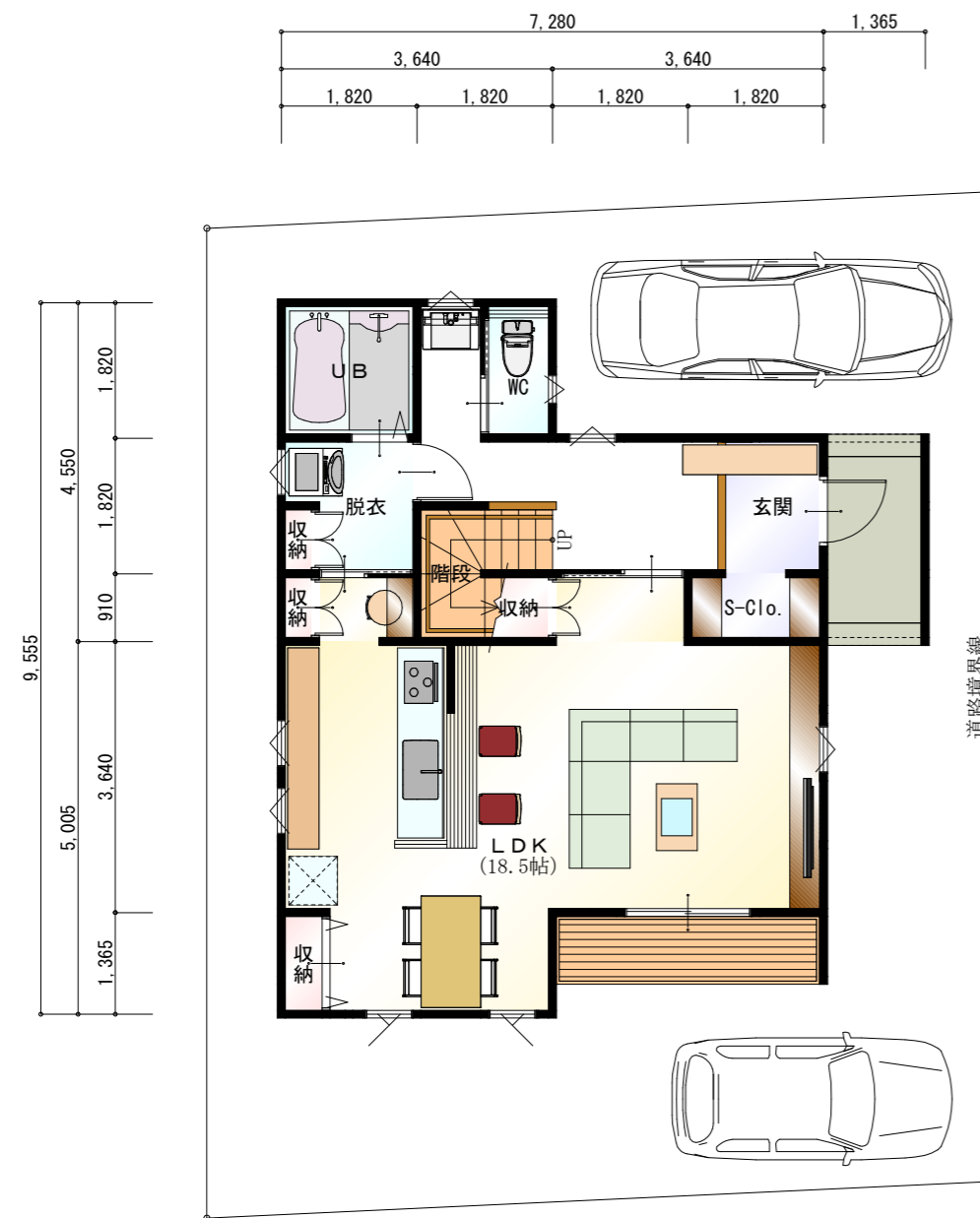
1階 平面図 S:1/100