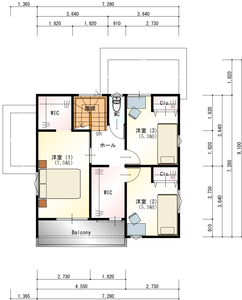
● 2階 平面図 S : 1 / 100