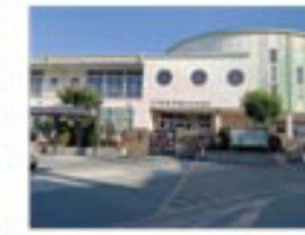
育英幼稚園 760m/徒歩約9分