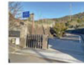
桑原中学校 1,100m/徒歩約13分