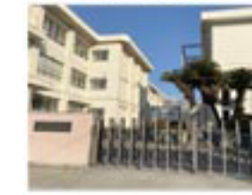
桑原小学校 1,150m/徒歩約14分